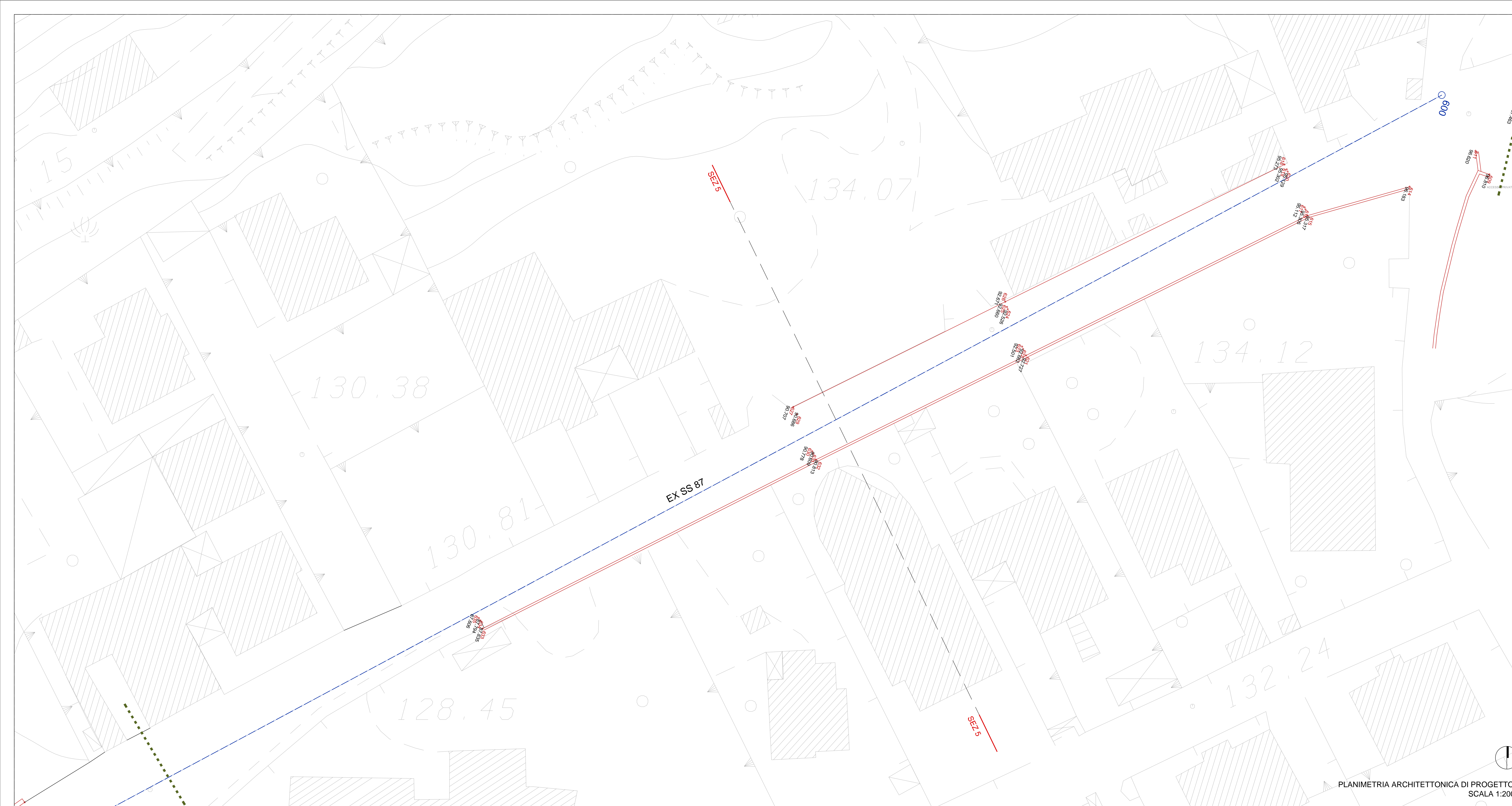
PLANIMETRIA ARCHITETTONICA DI PROGETTO SCALA 1:200